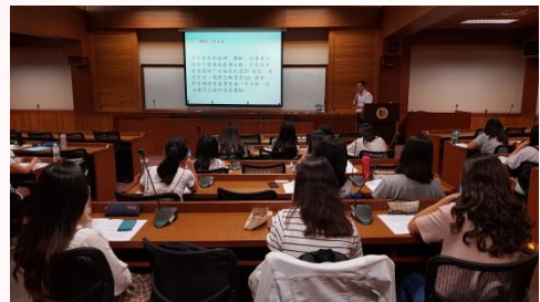
老師說明現今會展注重 參展民眾互動過程