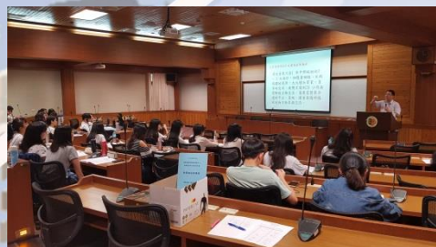
介紹台灣辦理會展模式的 演變