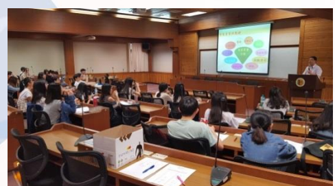
會展產業供應鏈關係已 有長足發展