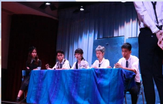
XF3A同學初賽戲劇演出