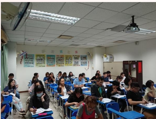
市民滿意本次課程主題設計

透過10次課程教學活動，除提升學生學習西班牙文之動機外，並期望透過與本市圖書館寶珠分館合作，提供市民學習西班牙文之多元管道，藉此推廣西班牙文學習風潮，使本系成為西班牙文教學與學習推廣重鎮，本次的課程為輕鬆學西班牙文之進階課程，95%參與本課程之市民皆表示延續上期課程能夠更加深學習重點，並滿意課程主題設計、肯定同學之西班牙文教學能力，且更認識西班牙文化。