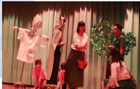
XF3A同學決賽戲劇演出