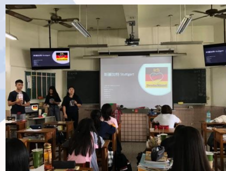
德國斯圖加特城市介紹