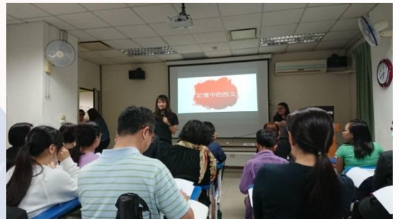
學生結合課堂所學達到學以致用的效果