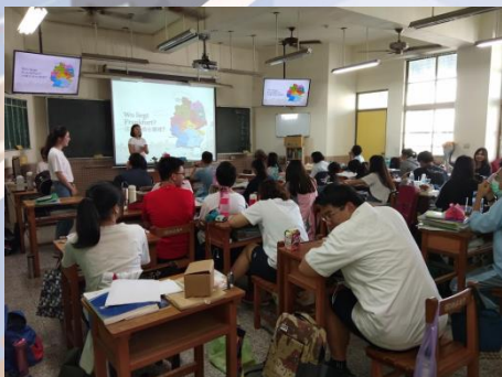
德國法蘭克福機場介紹