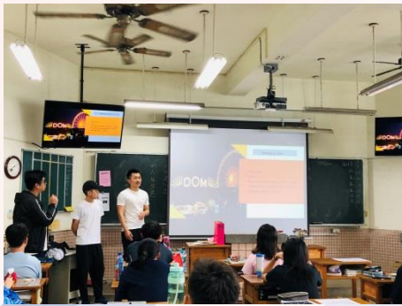
德國漢堡城市介紹

由德國語文「觀光德文(二)」選修學生37人分為6組，分別於星期四13:00-15:00赴高雄市立新莊高中進行6次德語教學，透過結合專業服務學習活動，由學生擔任授課教師介紹德國文化與人文知識，將其語言專業應用於實際教學，提升本系學生德語能力，更使本系學生結合上課所學達到學以致用之效果。另也激發高中生學習第二外語的動機，進而提升高中第二外語學生學習德語興趣。