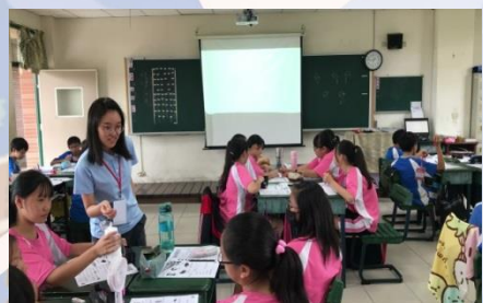
由藍美華老師帶領之 國中班英語服務教學