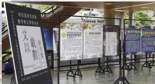
靜態展展覽實體內容