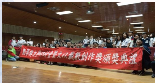
頒獎典禮現場師生合影