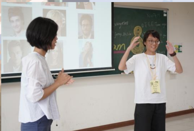
學生以全英語發表