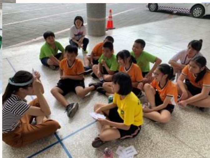
新生國小學生體驗戴頭說英文活動