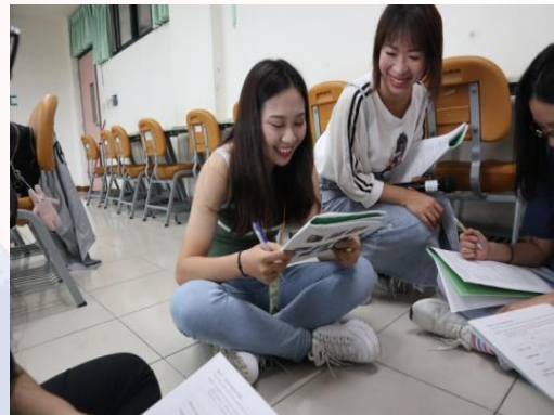
學生踴躍討論課題