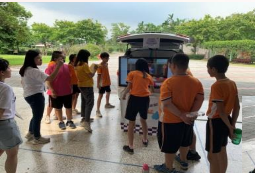
新生國小學生體驗E-Car打地鼠活動

英/外語能力診斷輔導中心期許透過文藻校內/外巡迴服務，擴展中心服務範圍，藉以開創高雄、南台灣及合作學校外語學習機制與氛圍，塑造外語學習的友善環境。