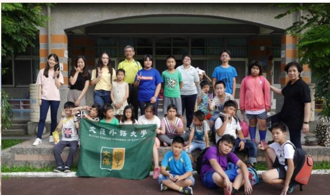
指導老師、文藻學生與國小學生合影

高雄市政府於108年4月14日頒發文藻外語大學熱心服務偏鄉感謝狀，更值得一提的是，龍目國小於108年5月8日參加高雄市英文歌曲比賽獲得甲等賞，此一佳音讓參與的學生習得感恩與付出外，也可藉由社會關懷與社會參與，強化全人教育及落實敬天愛人的精神與真義。