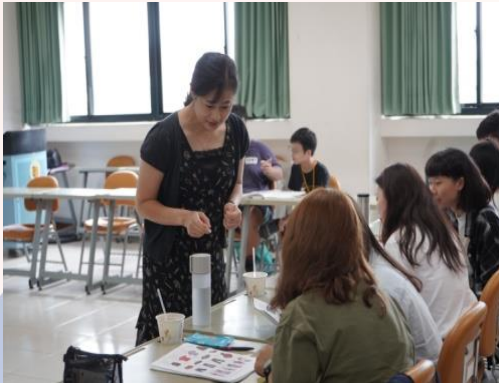
教師耐心指導學生

多元的活動除可讓新生提早了解校園及週邊環境，更透過團體生活建構團隊間的默契，充實人際關係，建立快樂學習氛圍。逾9成新生表示英語初戀營除讓他們認同文藻教育精神及理念外，更肯定營隊專業、多元文化的學習方式，認為營隊可增進他們對於熱愛生命、樂於溝通等軟實力的培養。