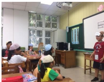
學生勇於開口猜謎情形