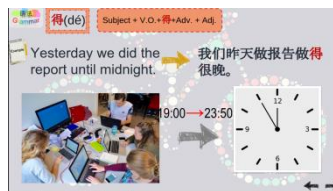
師資培訓教材—同步教學教材設計