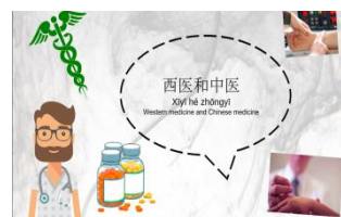
跨國遠距教學教材—跨文化溝通 （中西醫）