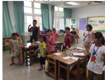
學生進行外語歌曲律動