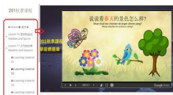
跨國遠距教學教材—生活華語（天氣和四季）