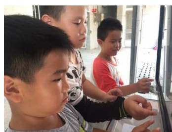
學生體驗數位互動遊戲