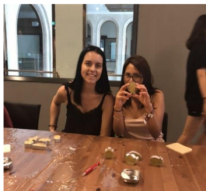
外籍生體驗鳳梨酥製作

此次營隊於107年07月14日至107年08月04日舉行，為期三周的時間，共吸引30位來自美國、西班牙、英國以及韓國等4所學校的學生與教職員前來參加，華語課程共計25小時、文化課程15小時（如：客家藍染、鳳梨酥製作、原住民文化體驗、太極功夫、紙雕中國結等）、移地學習40小時（如：橋頭糖廠、美濃等）、自習活動9小時等。營隊課程及活動讓外籍師生由淺至深的體驗台灣文化，並實際體驗課程，讓外籍生透過實際參與直接了解台灣文化背後的故事以及由來，進而對台灣文化產生興趣並增強學習華語之動機，本校學生也透過營隊期間與外籍生相互交流，不論是語言或是各國間文化皆是難得的交流機會。