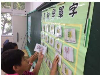
學生體驗字卡遊戲情形

活動中可發現，既使同為學習資源較缺乏地區，但因同學家庭環境背景不同，進而產生學習程度落差，深刻體會偏鄉老師的教學辛勞，特此中心安排以分組競賽形式，鼓勵學生於過程中主動互相幫助，一同成長。