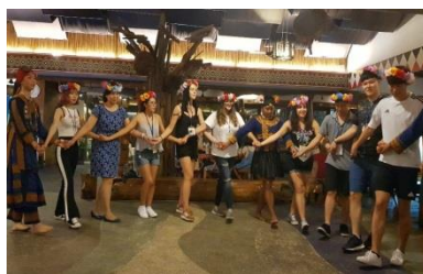
外籍生體驗原住民文化