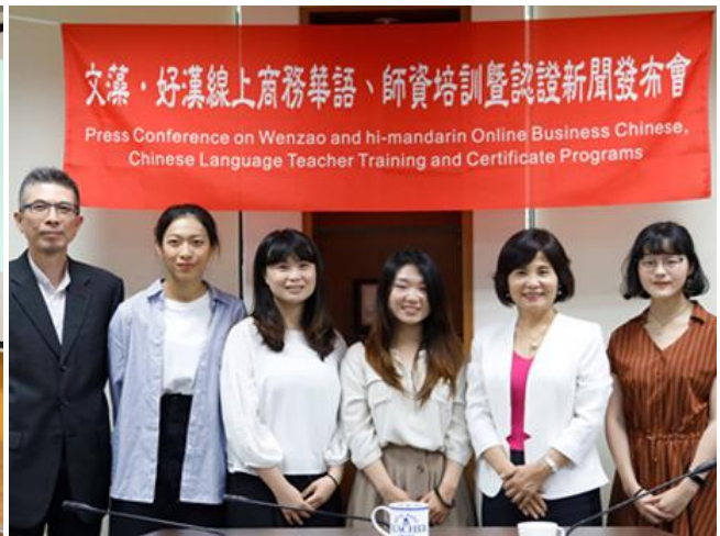
(圖/與好漢教育科技簽訂合作協議)