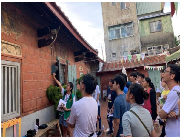
(圖/文化創意實踐營隊學生於左營郭家古厝英語導覽研習)

百年歷史的中外餅舖合作，作為文藻全英語人文創意實踐營啟動場域之一，達到以外語連接在地國際、創新啟動社區再造的目標。更規劃於 110 年 1 月結合傳播藝術系，推出新媒體創意實踐營，由參與學員學習中英文主播、短片剪輯與中英文廣播技巧，以達成宣傳舊城社區特色目標。