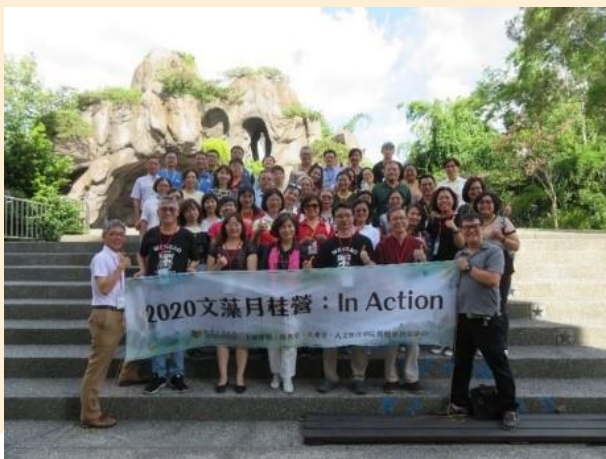
(圖/109年06月29日至06月30日文藻月桂營)

透過辦理月桂營、工作坊，並結合月桂方法與課程教學，希冀藉由月桂方法的思維：五個思維步驟，協助全校師生適時、適當地在教學、研究、學習、行政服務與輔導過程中運