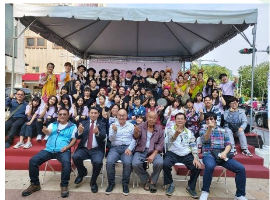
(圖/社區狂歡嘉年華貴賓、師長及表演學生合影)