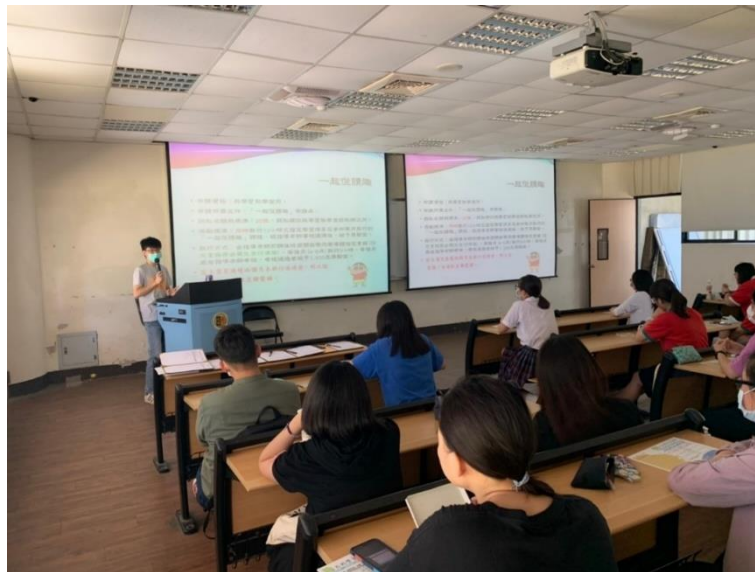
(圖/透過學習助學金說明會，協助經濟不利學生安心就學)

透過上述各項就學機制之建立及執行，109 年度共有 387 人獲得學習助學金補助，有 110 人成績進步，其中 15 人成績達全班前 3 名，成績優異或進步達一定標準通過者共計 55 人。107 年弱勢學生獲補助經費共 2,207,640 元；108 年共 3,595,000 元；109 年更高達 7,490,400 元，足見本校學生透過計畫獲得之實質輔導與補助逐年提升，並從多元探索及學習中成長，提升學生參與願意，且主動關注校內、外各類學習活動，藉此帶動身邊同學一起參與及學習，從中發現更多自己的潛能，以培養多方的學識與能力。