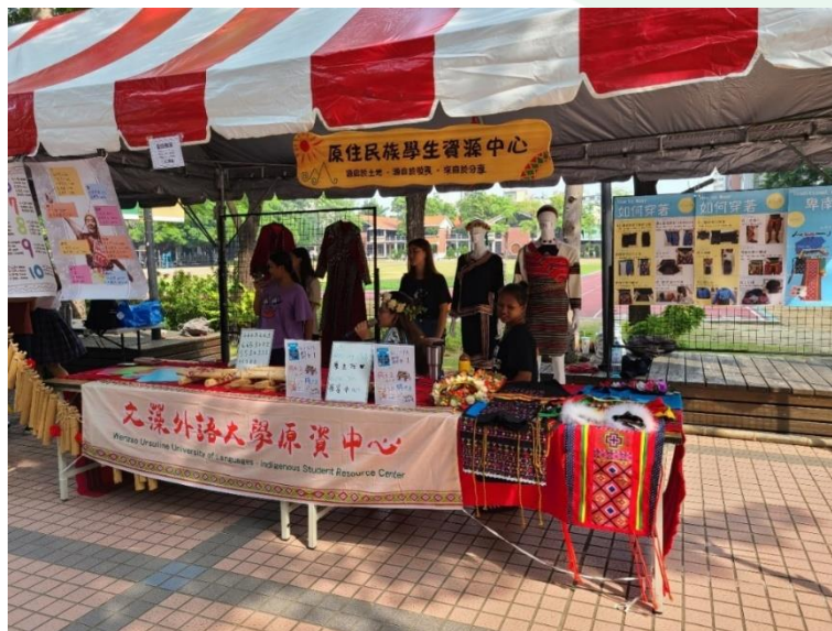
(圖/原民週原住民文物靜態展示)

此次「原民週」系列活動內容包羅萬象，包含傳統手作教學、部落美食分享、原住民文物靜態展示及原住民歌舞表演，透過多元文化之藝術活動，讓師生更認識原住民文化與部落生活特色，建立學生更友善的多元學習視野和宏觀的態度，並促進不同族群的情感交流，活動吸引師生逾百人參與。