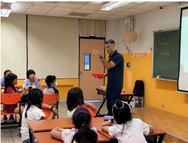
(圖/全英語教學認證活動)

線上華語培訓暨認證共分甲、乙兩級及商務級。甲級提供具華語教學背景者報考；乙級則不限科系、背景皆可報考；商務級則依合作機構之需求作客製化人才培訓。目前已完成培訓人數為 123 人，其中 109 人通過認證。