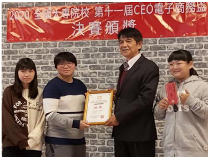
(圖/數位內容應用與管理系大二學生獲頒 2020 CEO 國際電子商務盃創業組冠軍)