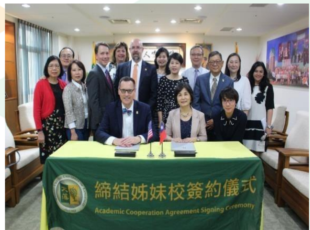
(圖/與美國聖多瑪斯大學休士頓分校締約儀式)