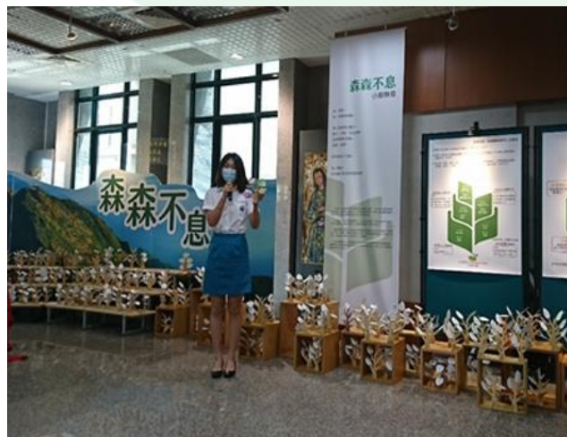
(圖/《森森不息》成人禮靜態展中學生分享月桂小樹)