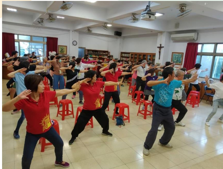
(圖/人文教育學院教導社區長者八段錦)

人文教育學院與社區 NGO 團體「耶穌聖名堂」簽訂合作備忘錄，正式開啟社區年長者服務的合作，計畫團隊藉由 12 次「長者關懷服務日」課程與 4 次教師社群活動，提升服務長者的專業知能，提供長者多元的活動內容，以開創優質的銀髮生活。