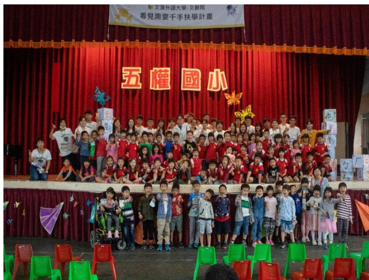
(圖/文教創意產業學院國小注音符號闖關活動結合遊戲闖關及注音符號學習)

文教創意產業學院師生團隊，於高雄市立五權國小每週進行至少三次、每次兩節的小一學生注音符號課輔服務，協助弱勢生學習，亦於每週三下午規劃兩節課的美術教學與藝術陪伴活動，透過志工團隊的引導，讓學生可以從美術創作中找到自信。「看見需要千手扶學計畫」以高雄市市區之國小小校之社會實踐為計畫起點，當社會大眾關注偏鄉學習需求的情況下，都市中依舊有許多教育資源弱勢的學童正等待著一盞為他照亮未來的燈。