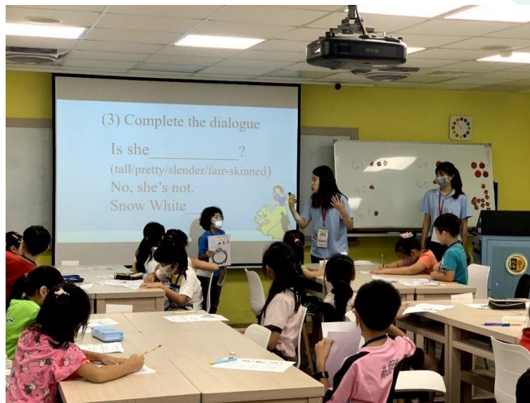
(圖/外語教學系同學認真教導兒童班練習英文單字，並邀請學員上台分享作品)

同時，遵循聯合國永續發展目標 (SDGs)，將大學社會責任列為校級目標，從校級高度整合校內能量，推動大學社會責任，以本校四個學院為核心，發展符合學院與系所特色及專業之服務活動，以校級資源持續推動、整合並引進外部資源、人力與鏈結，在中程校務發展的理念下，投入大學社會責任相關計畫之蹲點與實踐。