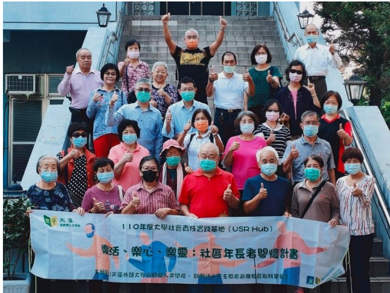
圖/文藻團隊與長者相見歡大合照

本校吳甦樂人文學院之「樂活、樂心、樂靈—社區年長者關懷」計畫，以年長者為關懷服務對象，110年運用學生團隊與吳甦樂人文學院轄下體育教學中心、通識教育中心、吳甦樂教育中心之專業師資，結合耶穌聖名堂同工團隊與地緣人脈，於耶穌聖名堂辦理12次年長者關懷服務活動，課程包含：體適能瑜珈、太極拳、契約與民事關係、全人發展、心靈彩繪療育等不同領域，更舉辦跨域社群講座，議題囊括健康管理、心理調適、法律實務、健康管理、靈性成長等層面，以增進教師與NGO志工之專業知能，每場次約30至35位長者參與。