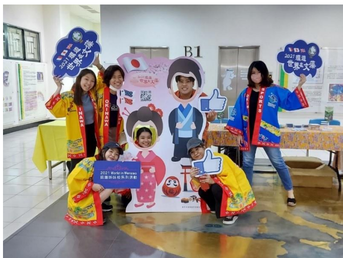
圖/日語月文化講座日本學生照片

儘管疫情肆虐，本校於 110 年度之國際化合作交流腳步仍未停歇，今年度新增 9 個雙聯學制合作項目，合作國際學術機構包含：英國艾塞克斯大學、西英格蘭大學、密德薩斯大學德國慕尼黑應用語言大學、俄羅斯波羅的海康德聯邦大學歐洲商業學院、法國里爾天主教大學國際商業學院，並與本校英國語文系、國際事務系、國際企業管理系、外語教學系、數位內容應用與管理系、傳播藝術系簽署雙聯學制合約。此外，本校亦積極與海外優質學術機構簽訂姊妹校合約，以開創未來合作契機，包含：紐西蘭坎特伯雷大學、英國西敏寺大學、美國南利諾大學、舊金山州立大學、加拿大麥基爾大學等。為擴展學生國際視野，加強與海外產官學界合作，本校選送學生至海外實習，與本校簽訂合約之海外實習機構多達 23 所。