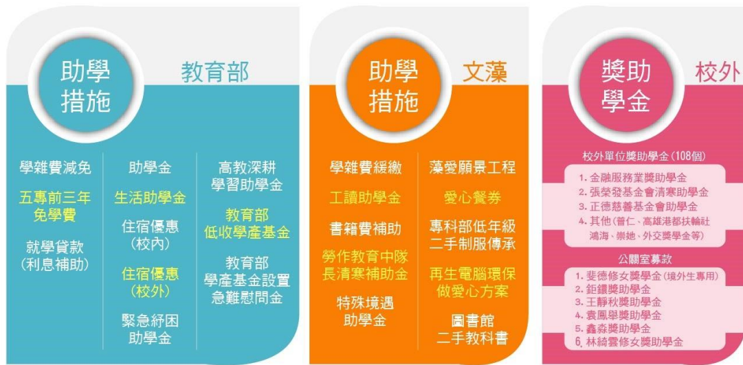
經濟不利學生就學照護系統架構圖

圖/透過經濟不利學生就學照護系統，建構友善循環的適性學習機制，輔導經濟不利學生與職場接軌