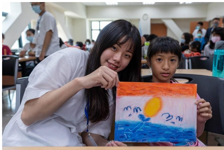
圖/崎豐、楠西、新豐國小學生進行藝術創作與藝術陪伴教學活動

此外，計畫整合教育部數位學伴資源，產出一系列線上教材，培養志工數位遠距課輔教學能力、軟體應用能力、教材編撰能力與口語表達能力、場域實作專業應用能力，110 年度共產出 88 部影片。（Oh!Show!繪課室-文藻小學堂： https://reurl.cc/3jLgn8 ），計畫團隊另參加由高雄市政府社會局舉辦之「攜手 20-志願服務創意影片競賽」，並獲得創意影片第三名殊榮！