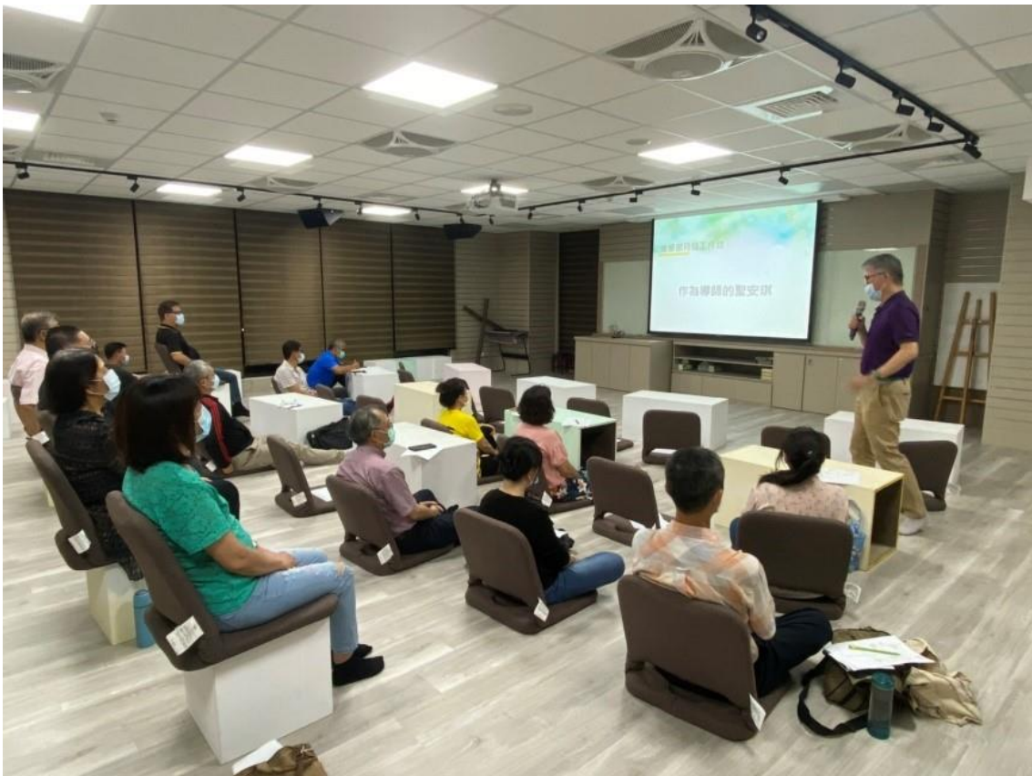
圖/月桂工作坊進修部導師場：介紹文藻月桂方法應用於生活議題之實作案例

此外，本校另結合文藻月桂方法於中心課程並設立教師社群，成員包含吳甦樂人文教育學院轄下三中心之教師。目的在使成員熟悉文藻月桂方法與聖安琪精神，並以實例帶領文藻月桂方法五步驟之運用，協助參與教師將文藻月桂方法融入教學方法與課程內容。110 年度共舉辦 6 場次教師社群、2 場期末成果發表研習會，共計參加教職同仁 82 人次。