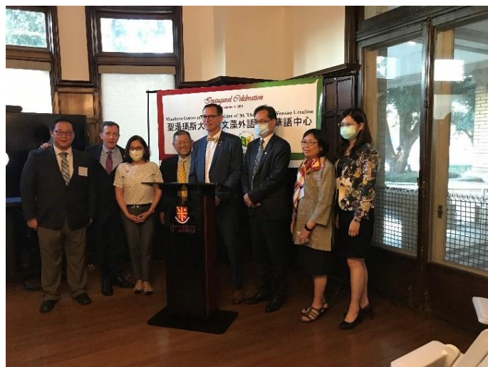
圖/外語大學團隊慶祝美國聖湯瑪斯大學華語教學中心成立