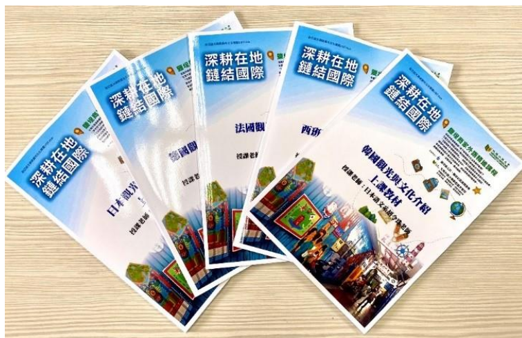
圖/歐亞語文學院觀光文化導覽 USR Hub 社區商家外語課程精進計畫教材

此外，歐亞語文學院完成鹽埕區觀光導覽影片拍攝及摺頁文宣設計，將以 7 種外語呈現（法語、德語、西班牙語、日語、泰語、越語、印尼語），電影短片將於市政府觀光局或捷運上播放宣傳。（影片連結： http://gofile.me/6UdFP/xM00LnHtp ）