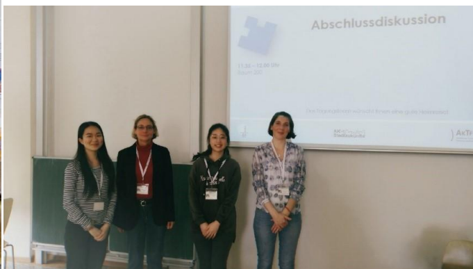
圖/交換生學生與同學參與觀光研討會合影

於疫情影響下，本校學生仍可於台灣透過線上修課方式完成學業，並與國外師生進行交流，今年度共計有 97 位學生以出國或線上方式進行國際學術交流。教師亦透過線上方式參與國際研討會，行政主管們參加海外教育視訊論壇，除了與各國學者專家意見交流，同時也提升本校國際能見度。