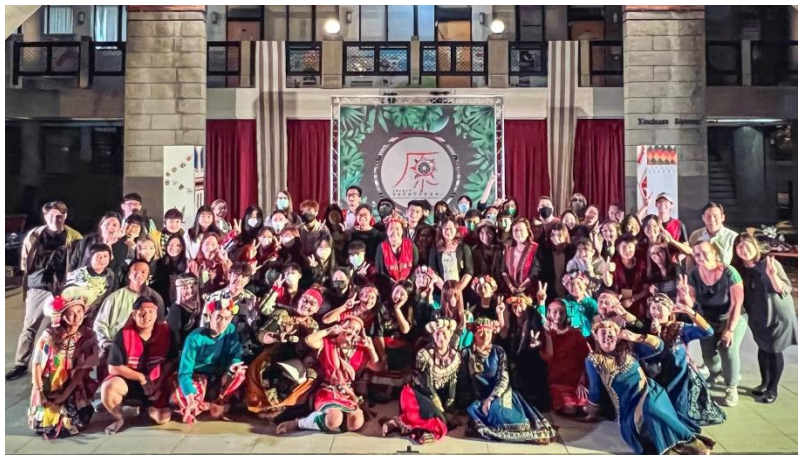
圖/透過辦理原民之夜，促進各學校原住民學生相互交流學習，帶動全民原教

本校於 110 年度舉辦 文藻原住民之夜 ，促進各學校原住民學生相互交流學習，強化認同感、歸屬感及凝聚力，落實發揚原住民族文化，增進不同族群文化的認識與融合，帶動全民原教。此次活動為本校及原生代社團 110 年度成果呈現，包含：傳統手作物品呈現、部落美食分享、原住民歌舞表演，透過多元文化藝術活動，讓師生更認識原住民族文化與部落生活特色；其中，加入「原來有你」分組分享及探討，涉及生性樂觀、歧視、喝酒文化及多元族群等原住民相關議題，建立學生更友善的多元學習視野和宏觀的態度，並促進不同族群的情感交流，活動吸引師生逾百人參與。