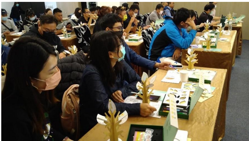
圖/企業教育訓練活動使用月桂小樹操作盒

今年度另針對文藻月桂方法操作教材「月桂小樹」進行優化設計。依照過往課程與工作坊的經驗，搭配手作教材的操作能夠將文藻月桂方法概念予以實體化呈現，並展現個人化的獨特風貌，強化參與者的學習動機與成效。藉由重新設計教材，加強操作的豐富度、完整性、平整包裝及外觀美化。透過工作坊的課程設計，讓每位參與者能夠經由講師說明引導後，潛心且專注地完成極具個人特色的月桂小樹。