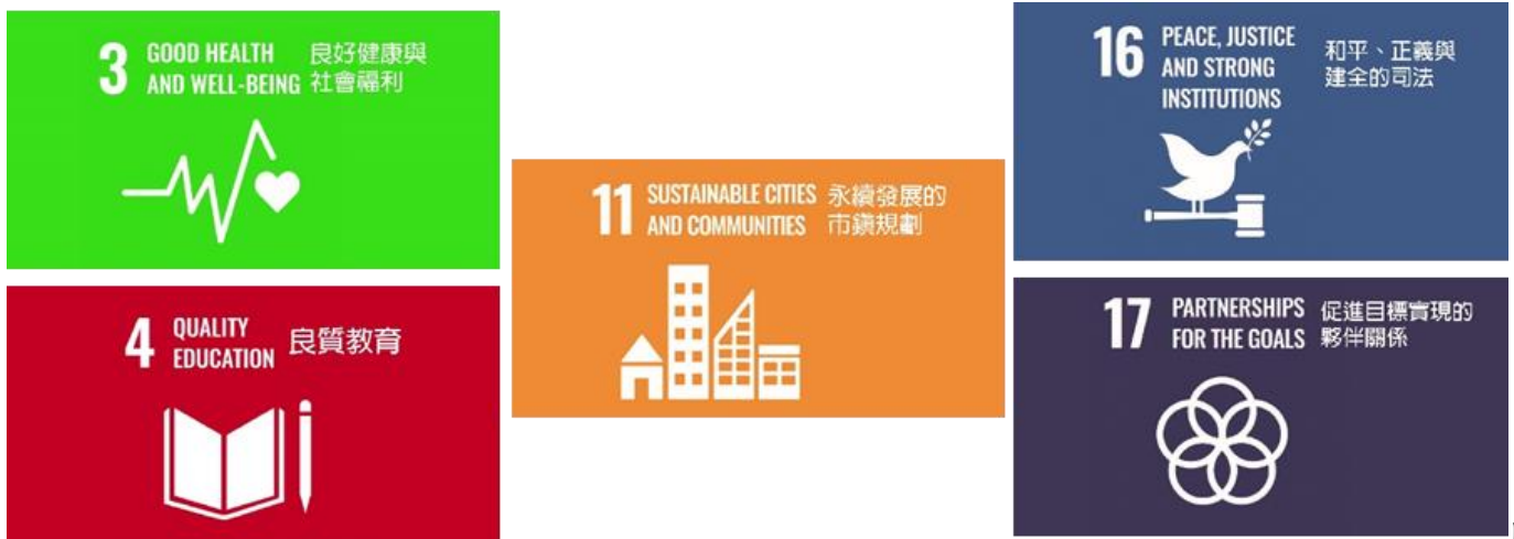
/銜接多項聯合國 SDGs 主題

今年度共計有 41 位、近 10% 校內教師直接投身計畫推動與在地服務，以行動回應社會需要，落實大學社會責任，擴展本校語言培育能量值，並帶領 447 位學生、結合 20 門課程，將社會投入與跨域學習之概念融入，並銜接多項聯合國 SDGs 主題（SDG 3, 4, 11, 16, 17），落實並傳承聖吳甦樂會與天主教高等教育辦學理念，整合師生服務，逐步實踐大學社會責任。