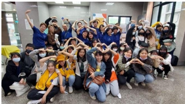
圖/計畫師生團隊投入「移工文化-轉機在台灣-共融友好」移工攝影展活動

以上的實踐精神，推助文藻學生運用語言專長及志工受訓期間所學，能夠望眼世界，將知識轉為力量，人人發揮其小螺絲的能量，轉化成為他人在社會或世界上的祝福，以身體力行傳達唯有「愛」能無遠弗屆地超越國界及語言，以大學為養分，滋養更具有世界觀與國際移動力之未來型人才。